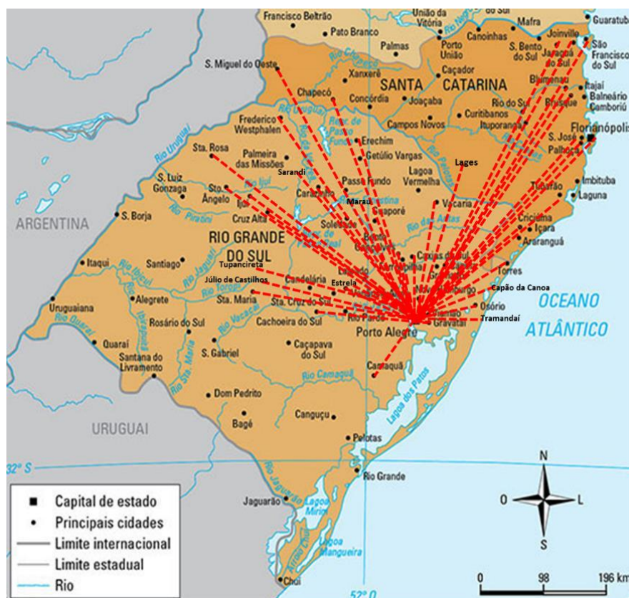
Figura 1: Trajeto percorrido pelas fiscais entre janeiro e dezembro de 2016.

Na figura 1, podem ser observados os trajetos percorridos pelas fiscais do CRBM-5 no período de janeiro a dezembro de 2016.