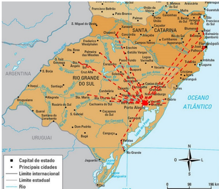
Figura 1: Rotas percorridas pela Fiscalização em 2015, na jurisdição do CRBM-5.

Jurisdição: Rio Grande do Sul e Santa Catarina CNPJ 13738204/0001-76